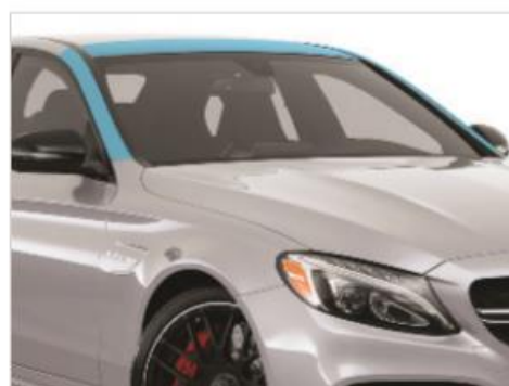
Aピラー/ルーフライン