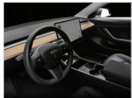
車内インテリア表面