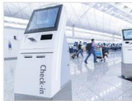
商業使用タッチスクリーン