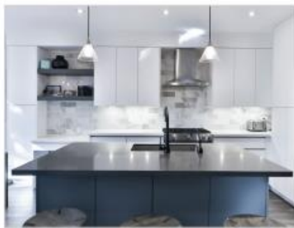
天板・作業台・機材等

商業・工業施設にて使用されているモニターや清潔に保ちたい箇所、ドアの取っ手や手で触る部分、クルマ社内のインテリア・モニター、個人用デバイス等 その他