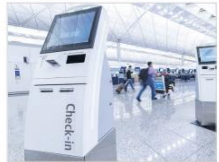
商業使用タッチスクリーン